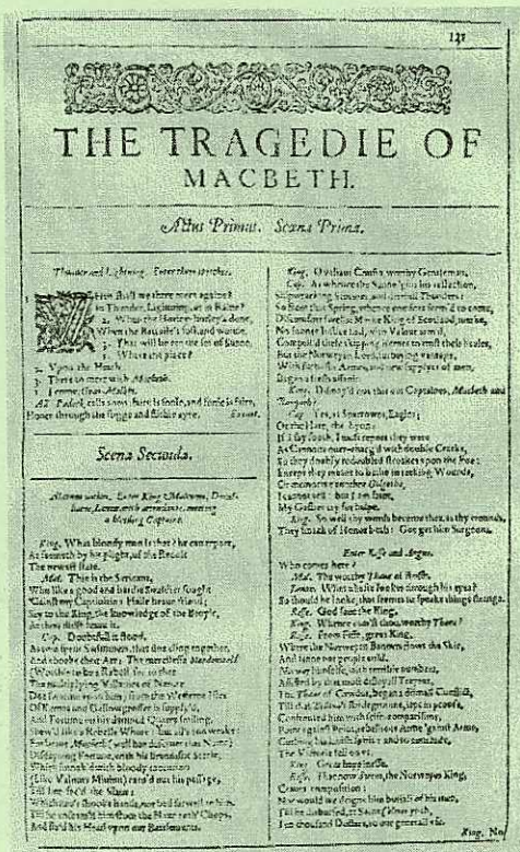
演劇博物館所蔵 ウィリアム・シェイクスピア「ファースト・フォリオ」(複製)より (ロンドン、1910年出版)

『マクベス』第五幕でマクベスの語るトゥモロウ・スピーチはシェイクスピア作品の中でも屈指の名台詞として知られています。「明日、明日、明日…」と、時の流れを淡々と語るこの一見平凡な台詞がなぜこれほどまでに名台詞になり得たのでしょうか。作品全体を通底する時間観について考え合わせながら、この台詞の持つ意味を問い直してみたいと思います。